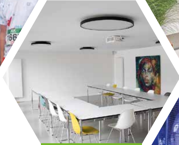
Besprechungsraum in Schwerte