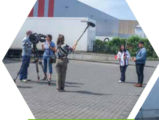
WDR-Filmaufnahmen und Interview im Studio Dortmund