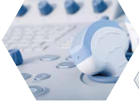
Ultraschallgerät und Schrittmacher-Programmer