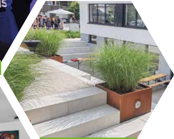
Innenhof in Schwerte