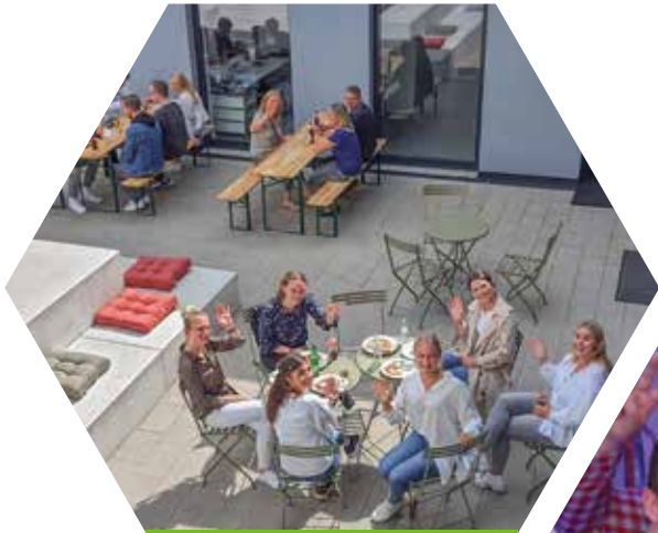
Grillfest in Schwerte