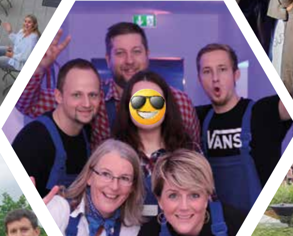
Party auf unserer Baustelle