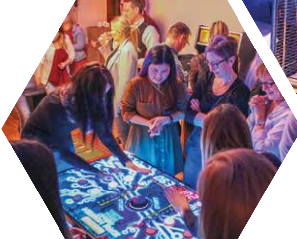
Spielen geht immer