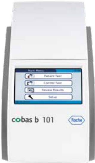
cobas® b 101 7716709