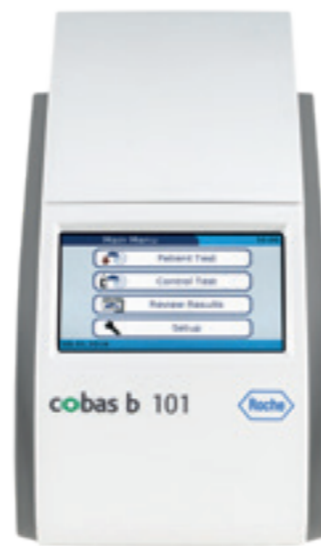
cobas® b 101 Art.-Nr.: 7716709