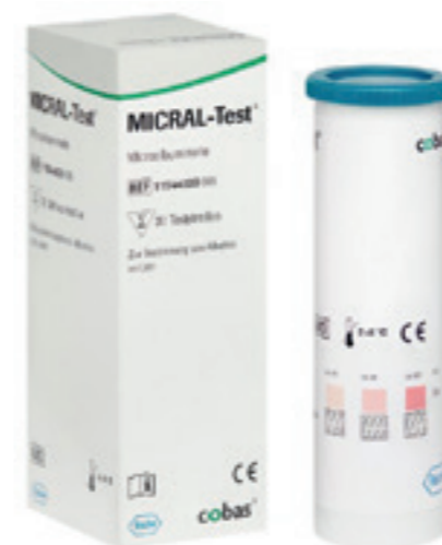
MICRAL Test® Art.-Nr.: 5025003 39,20 €