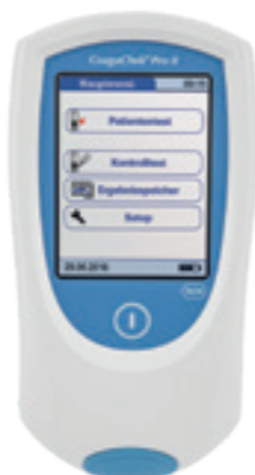
CoaguChek® Art.-Nr.: 7187950

QR-Code scannen und PDF- Broschüre lesen