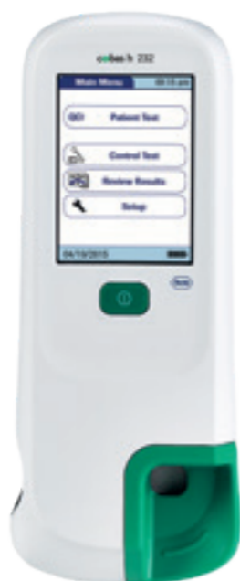
cobas® h 232 Art.-Nr.: 5944017