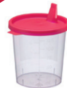
100 Urinbecher, 125 ml Art.-Nr.: 5510465 Ab 8,30 €