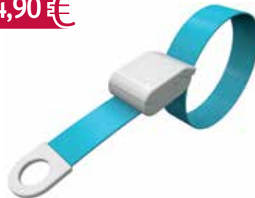
daisygrip® Venenstauer, desinfizierbarer Gurt Art.-Nr.: 7329417