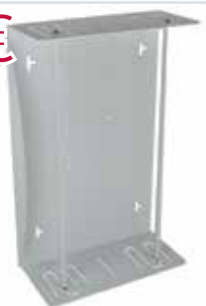
Universelle Handschuhhalterung, Platz für 3 Packungen Art.-Nr.: 5500205