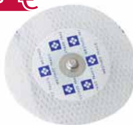
EKG-Einmal-Klebelektroden, Gewebeträger, 30 Stück Art.-Nr.: 5810169