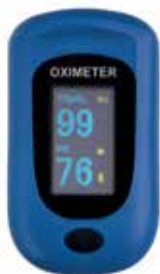
Fingerpulsoximeter PC-60B Art.-Nr.: 7400945