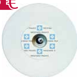
EKG-Einmal-Klebelektroden, Schaumstoffträger, 1.200 Stück Art.-Nr.: 5810172