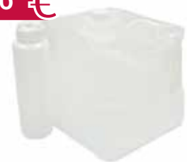
Ultraschallgel Cubitainer, Quetscheimer, 5 Liter Art.-Nr.: 7079619