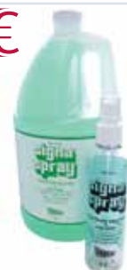
Elektrodenkontaktspray, 3,8 Liter Art.-Nr.: 7010897