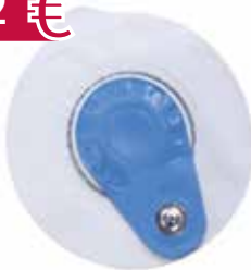
EKG-Einmal-Klebelektroden, Vliesträger, 25 Stück Art.-Nr.: 5933111